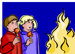
JOCUL COPILOR CU FOCUL