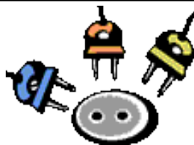
INSTALAȚII ELECTRICE DEFECTE SAU IMPROVIZATE

Cele mai multe incendii datorate focului deschis au loc în zona rurală: la gospodăriile populației, păduri (mai ales primăvara), la culturi agricole (pe timpul campaniei agricole de vară și toamnă).