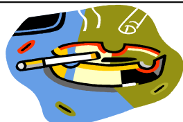
FUMATUL ÎN LOCURI CU PERICOL DE INCENDIU

Incendiile provocate de instalațiile electrice se soldează cu pierderi materiale ridicate și de multe ori cu victime omenești.