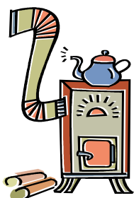
MIJLOACE DE ÎNCĂLZIRE DEFECTE, IMPROVIZATE SAU NECURĂȚATE

Numărul copiilor, victime ale incendiilor, este în continuă creștere.